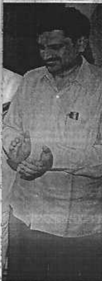
স্বকাজে খারগে।

সিপি ও এস-১২০ ব্যবহার করতে হবে। আর উন্নত আয়ের বীজ কিনে অবশ্যই তা শোধন করে নিতে হবে। এছাড়া ভাল চাকের সাথেই চাঞ্চির জীবাণু সার ব্যবহার করতে হবে। সেই জন্যই বিছাপ্রতি বীজের সঙ্গে ২০০ গ্রাম জীবাণু সার মর্ষিয়ে রাখতে হবে। অরপের জাঘাতে শুকিয়ে জমিতে প্রয়োগ করতে হবে। জমিতে সুবর্ণ সার হিসেবে জৈব এবং রাসায়নিক সার ব্যবহার করতে হবে। ভাল জাতীয় শস্যের মধ্যে কমলা সালাফার বা গন্ধকেরও প্রয়োজন আছে। আর সেই কারণেই সিঙ্গেল সুপার ফসফেট সার ব্যবহার করেই প্রয়োজনীয় সালাফার প্রয়োগ করতে হবে। তবে ডালের উৎপাদন বৃদ্ধির জন্য বরোন ও মলিনচোম এই দুই অনুশাসনেরও যথেষ্ট ভরস্ব আছে।